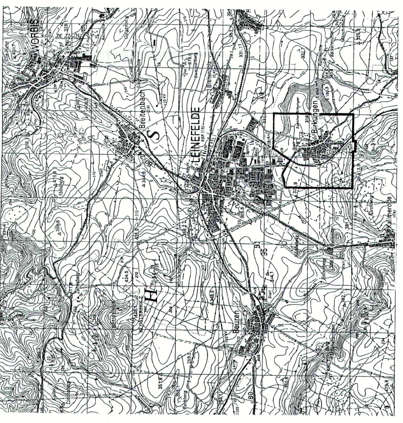
Übersichtskarte zum Kartenausschnitt / Maßstab ca. 1:50 000.

Hinweis: In der Urschrift der 1. Änderung/Ergänzung des Flächennutzungsplanes Leinefelde - Blatt Birkungen - sind nur die Bereiche der 1. Änderung/Ergänzung farbig dargestellt. Die übrigen schwarz-weiß dargestellten Bereiche entsprechen der genehmigten Fassung vom 19.08.1998. Der als Wohnbaufläche dargestellte Bereich „Bei der Station“ südlich der Bahnhalle in Birkungen ist gemäß § 6 Abs. 3 BauGB von der 1. Änderung/Ergänzung des Flächennutzungsplanes ausgenommen. Diese Entscheidung des Thüringer Landesverwaltungsamtes vom 19.08.1998. Diese Fläche bleibt weiterhin ausgenommen.