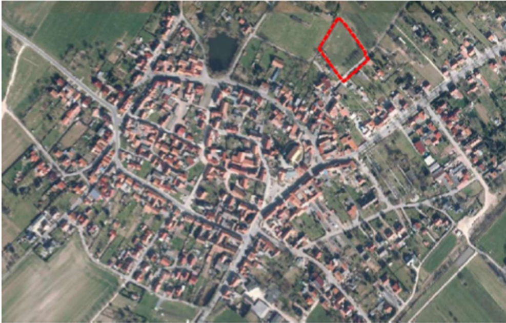
Geltungsbereich Vorhabenbezogener Bebauungsplan Nr. 77 – 1. Änderung „Kliengasse Hunold GbR“, der Stadt Leinefelde-Worbis, OT Breitenbach